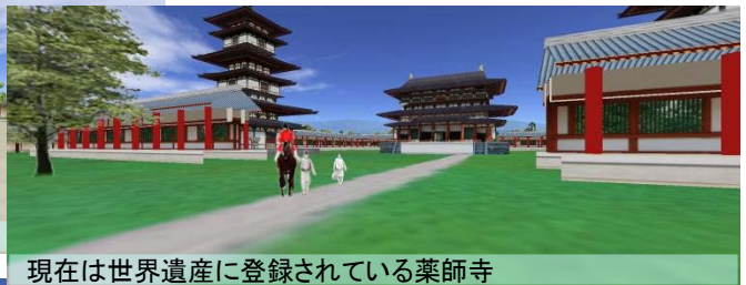
現在は世界遺産に登録されている薬師寺