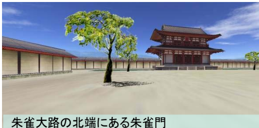
朱雀大路の北端にある朱雀門

コンピュータ・グラフィックス(CG)で再現された平城京の街並みの中を自由に散策してみませんか? あたかも奈良時代にタイムスリップしたかのような風景がパノラマ大画面内に展開されます。現在復元中の大極殿や幅74mあったと言われている朱雀大路の様子も体感していただけます。