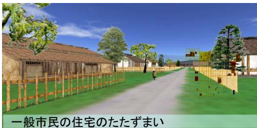
一般市民の住宅のたたずまい